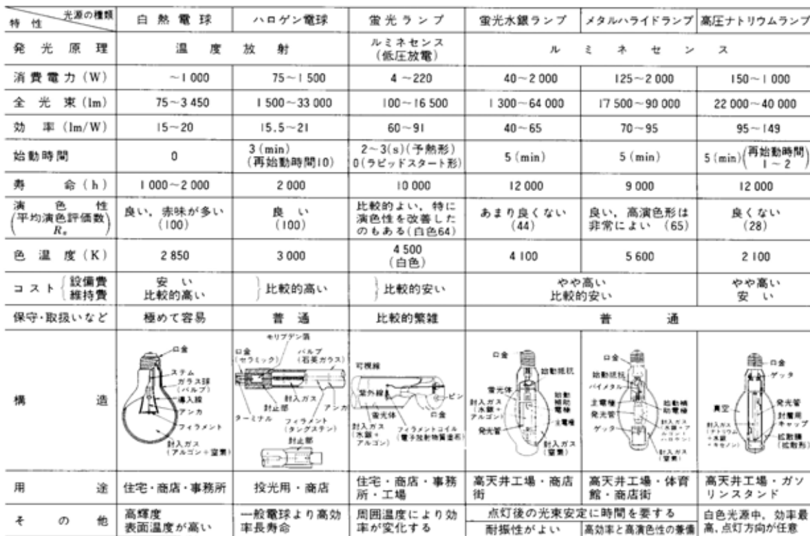
表 主な光源の性能と特徴（出典：参考文献 [1]，p. 37）